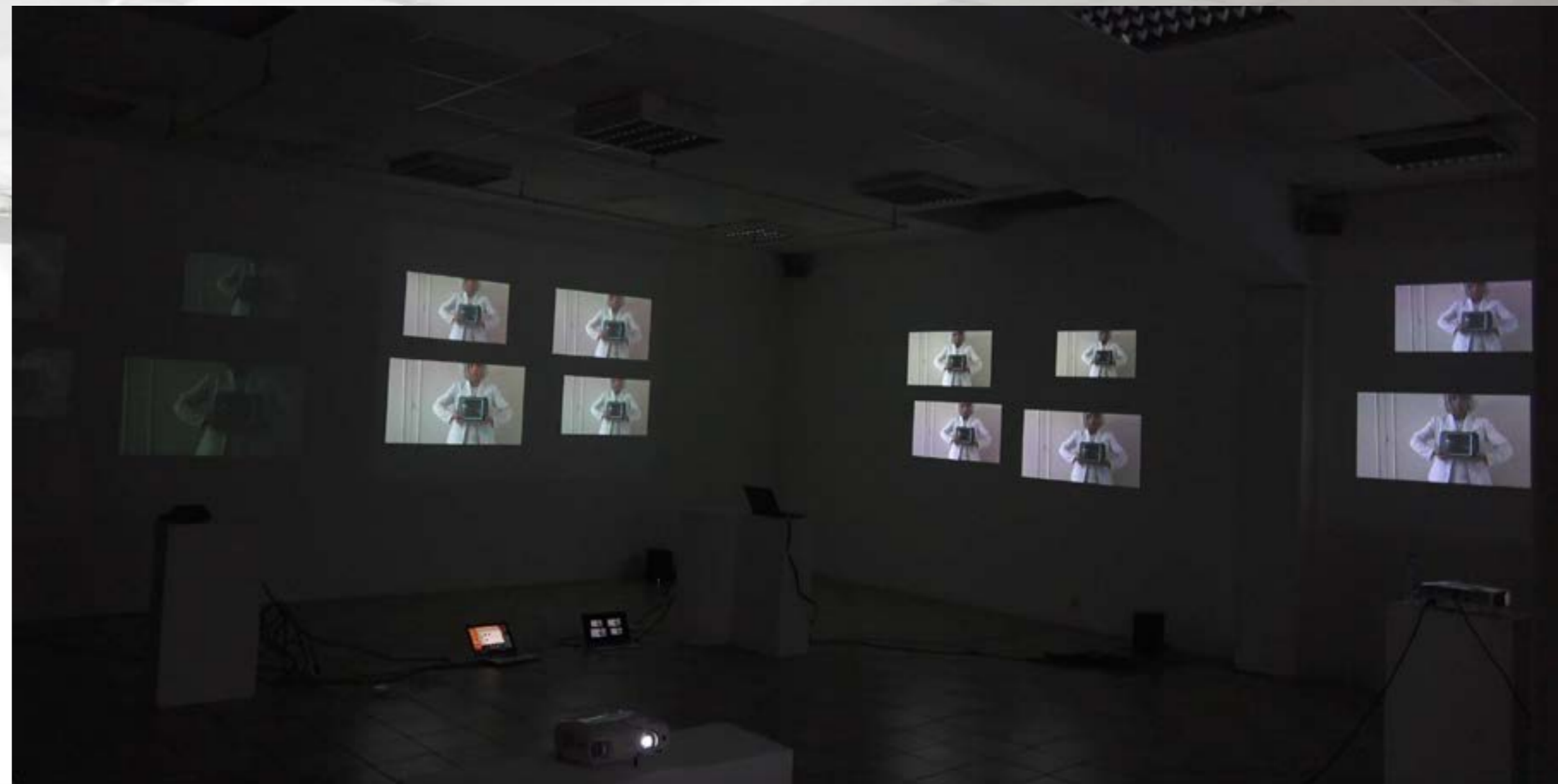
Installation vidéos «Univers ambulants, 10min, 5 projections, 2020.