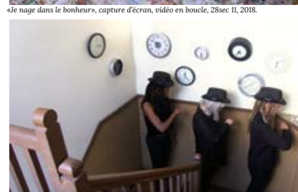
«Pas le temps», capture d'écran, vidéo en boucle, 22sec 09, 2018.