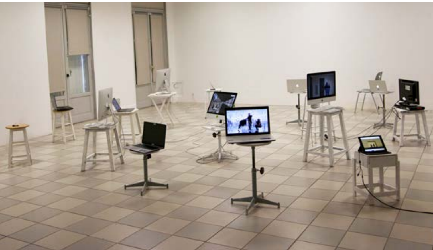
Installation de 20 vidéos en boucle, sur ordinateurs, tablettes et téléphones, 2018.

«Un quotidien absurde qui tourne en rond» est une installation présentant un ensemble de vidéos courtes, qui tournent en boucle. Le visiteur y découvre des personnages qui effectuent des gestes sans but précis, donnant vie de façon ludique et absurde à des objets du quotidien, qui pourraient paraître ordinaires et inintéressants. L'ambiguïté se crée et tous les composants forment alors l'étrangeté que je cherche à mettre en place. La bande sonore nous entraîne davantage dans cette profusion d'images, puisqu'au fur et à mesure que le visiteur entre dans la salle, les vidéos se mettent en marche créant alors une cacophonie.