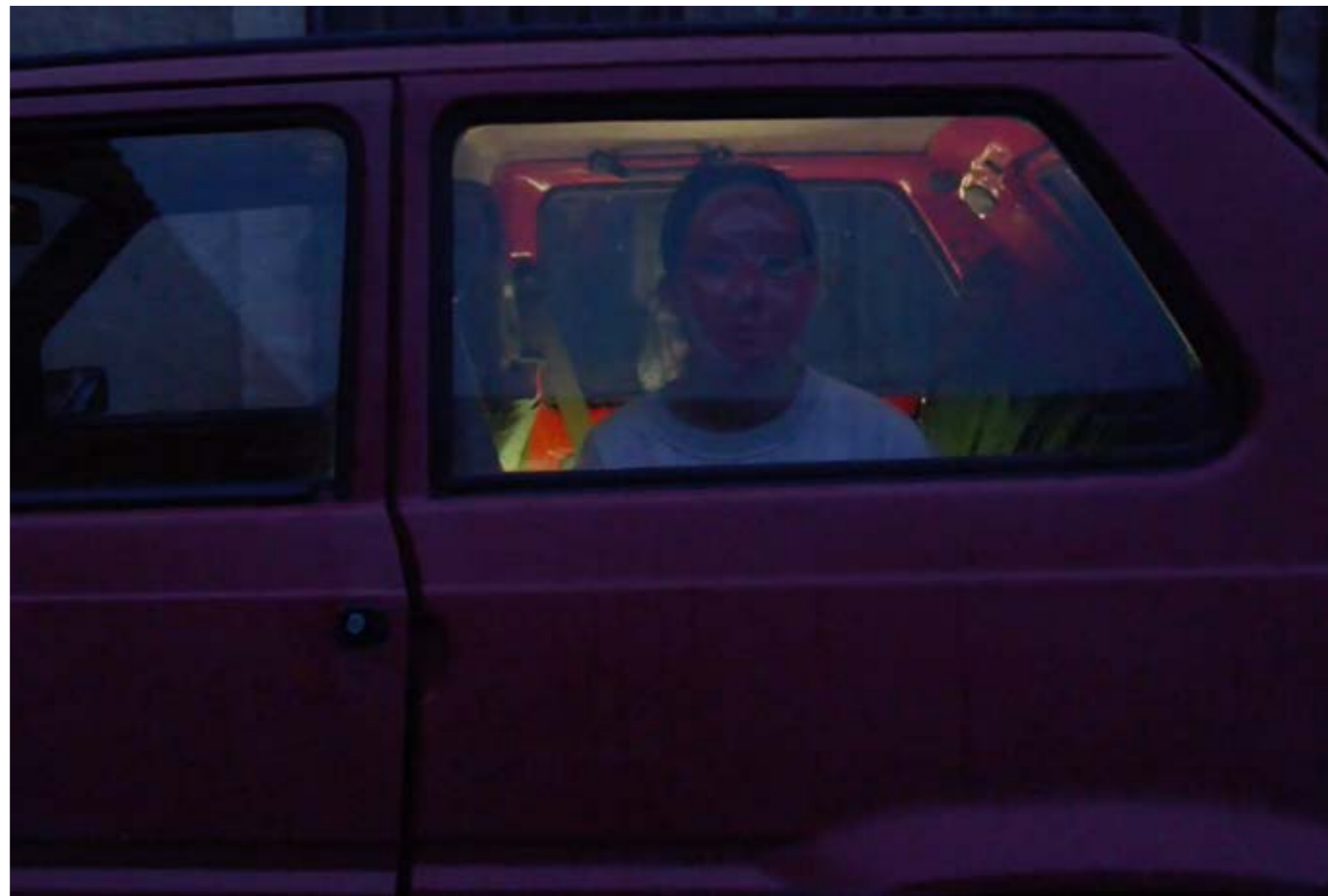
Capture d'écran, extrait vidéo de l'installation «Univers ambulant», (2020)