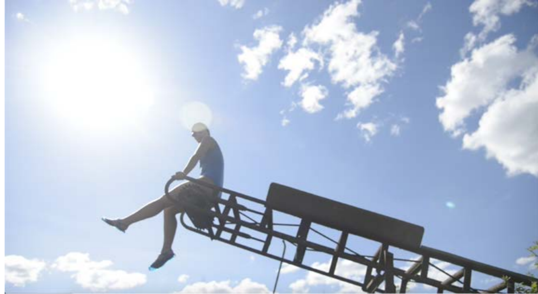
Capture d'écran, extrait vidéo de l'installation «Univers ambulant», 2020.