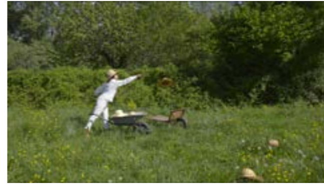
Capture d'écran, extrait vidéo de l'installation «Univers ambulant», 2020.