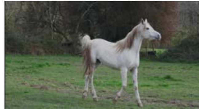
Capture d'écran, extrait vidéo de l'installation «Univers ambulant», 2020.