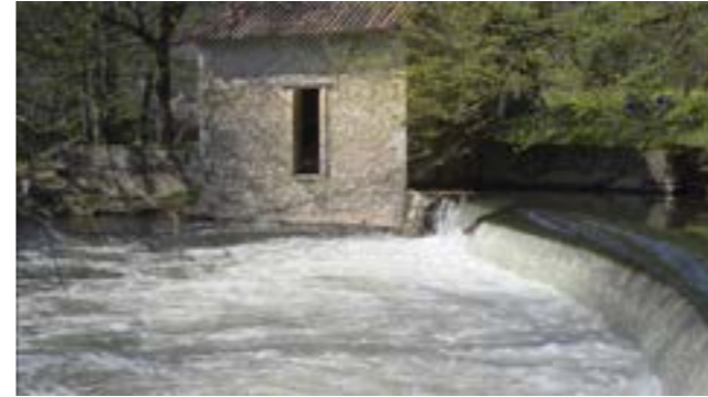
Capture d'écran, extrait vidéo de l'installation «Univers ambulant», 2020.