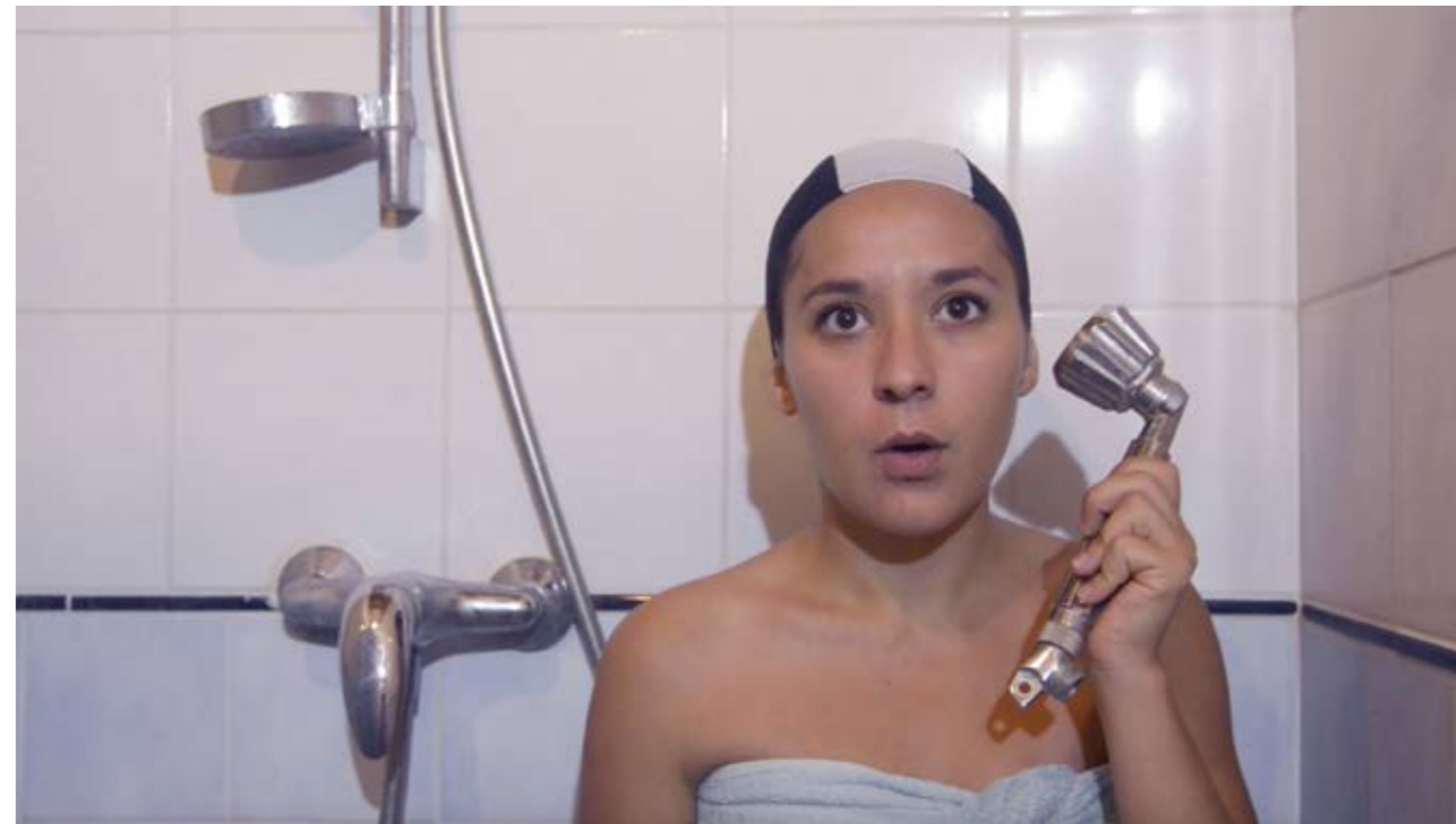
Capture d'écran, extrait vidéo de l'installation «Univers ambulant», 2020.