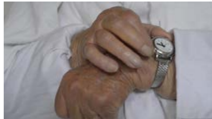
Capture d'écran, extrait vidéo de l'installation «Univers ambulant», 2020.