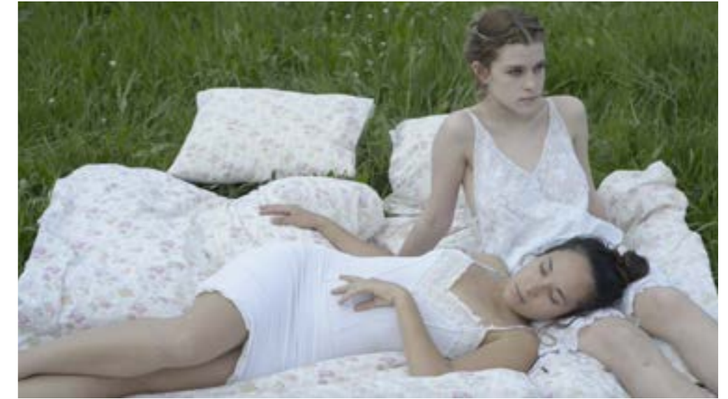
Capture d'écran, extrait vidéo de l'installation «Univers ambulant», 2020.