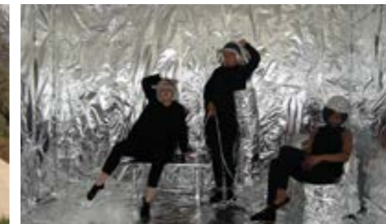
«Allumez-moi», capture d'écran, vidéo en boucle, 40sec 17, 2018.