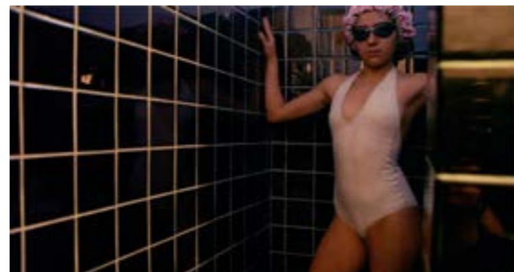
Capture d'écran, extrait vidéo de l'installation «Univers ambulant», 2020.