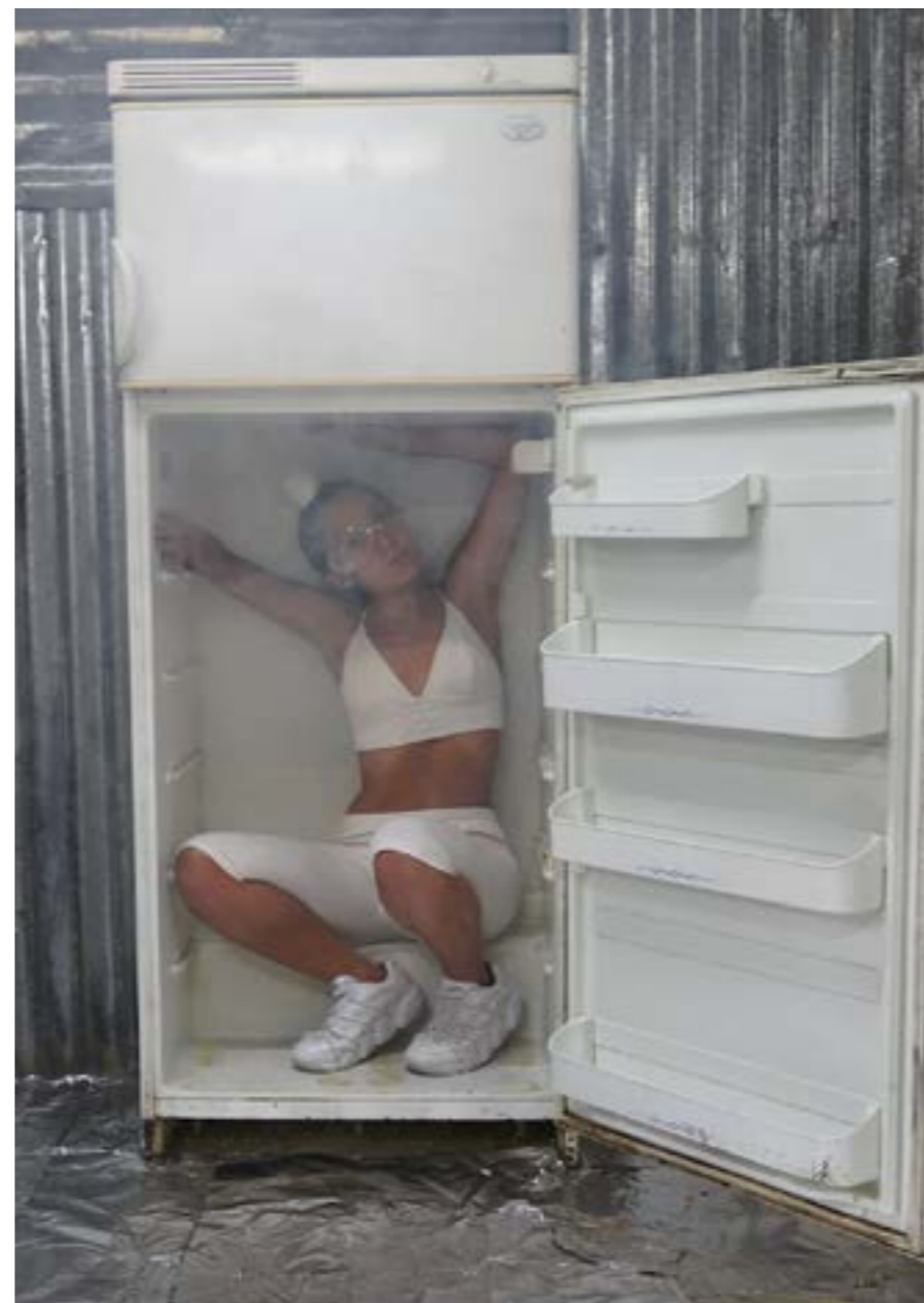
Capture d'écran, extrait vidéo de l'installation «Univers ambulant», 2020.