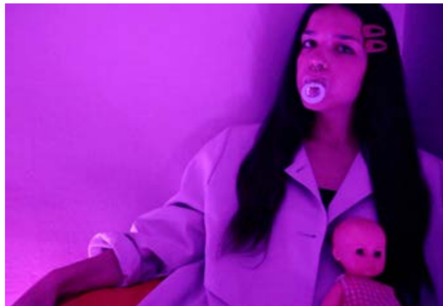
Capture d'écran, extrait vidéo de l'installation «Univers ambulant», 2020.