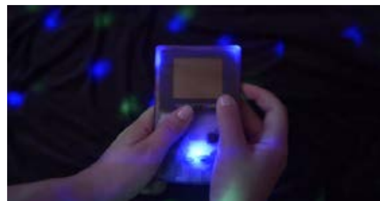
Capture d'écran, extrait vidéo de l'installation «Univers ambulant», 2020.