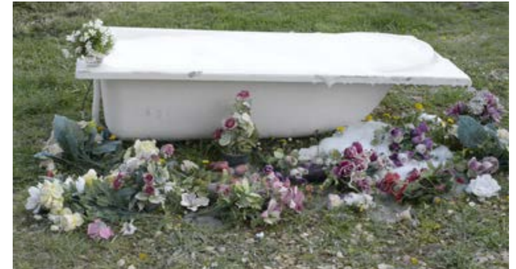
Capture d'écran, extrait vidéo de l'installation «Univers ambulant», 2020.