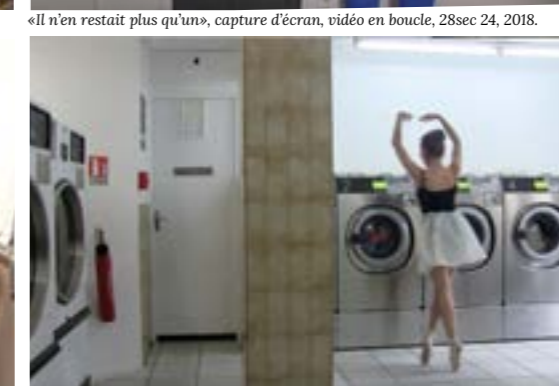
«Salle de ballet», capture d'écran, vidéo en boucle, 28sec 11, 2018.