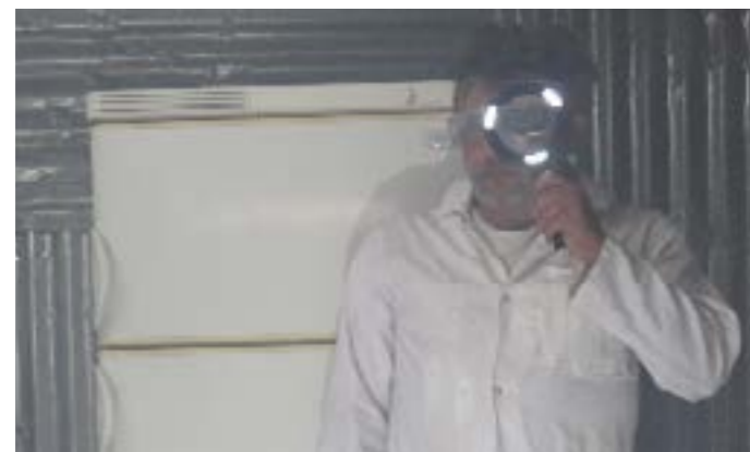
Capture d'écran, extrait vidéo de l'installation «Univers ambulant», 2020.