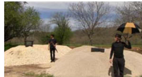
«Pluie mécanique», capture d'écran, vidéo en boucle, 30sec, 2018.

Visuel, Partager, Flux continu d'information, Immédiat, Prêssé, Quotidien, Mode, brouhaha sonore, Absurde, Instantanément, Interactif, Réseau sociaux.