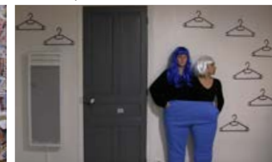
«Il n'en restait plus qu'un», capture d'écran, vidéo en boucle, 28sec 24, 2018.