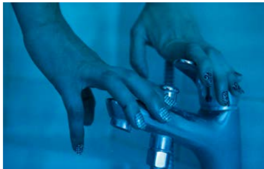
Capture d'écran, extrait vidéo de l'installation «Univers ambulant», 2020.