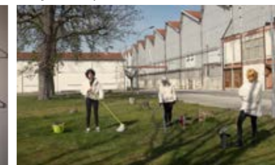
«Les 3 glorieuses», capture d'écran, vidéo en boucle, 20 sec, 2018.