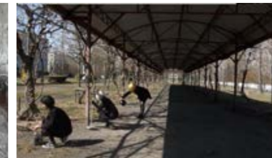
«Cortège Moulinex», capture d'écran, vidéo en boucle, 55sec 15, 2018.